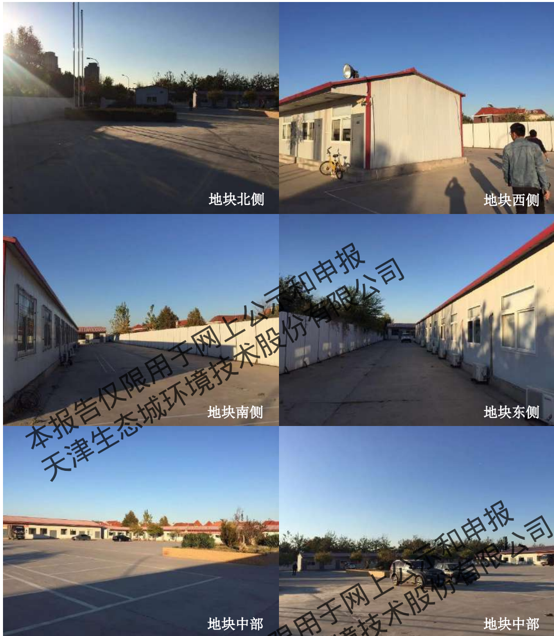
图 2.2-4 地块现状照片（2018 年 10 月）