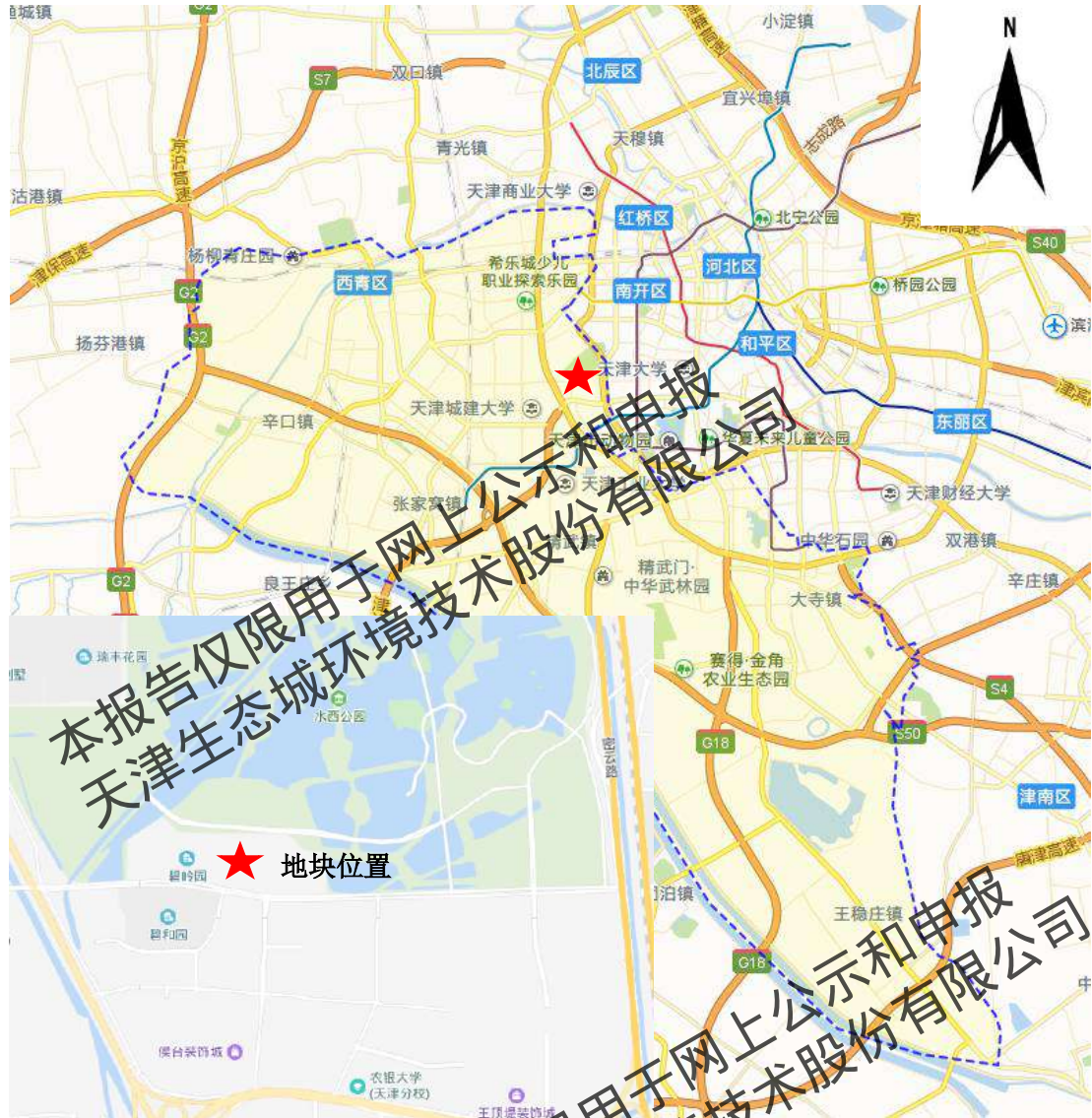
图 2.2-3 地块位置示意图

T 地块位于天津市西青区东北部，外环西路以东，临近水西公园，位置示意图见图 2.2-3。