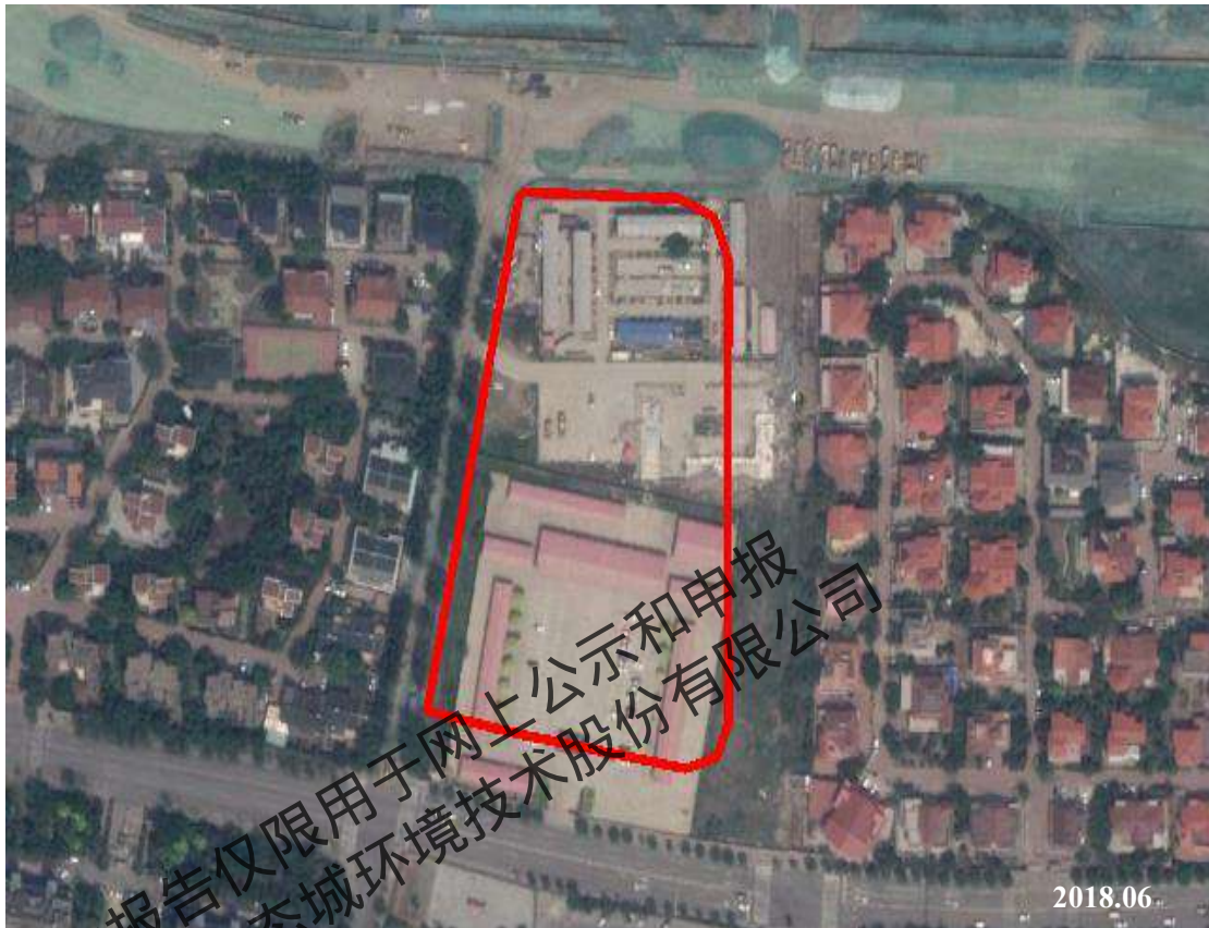
图 2.2-5 地块历史影像图