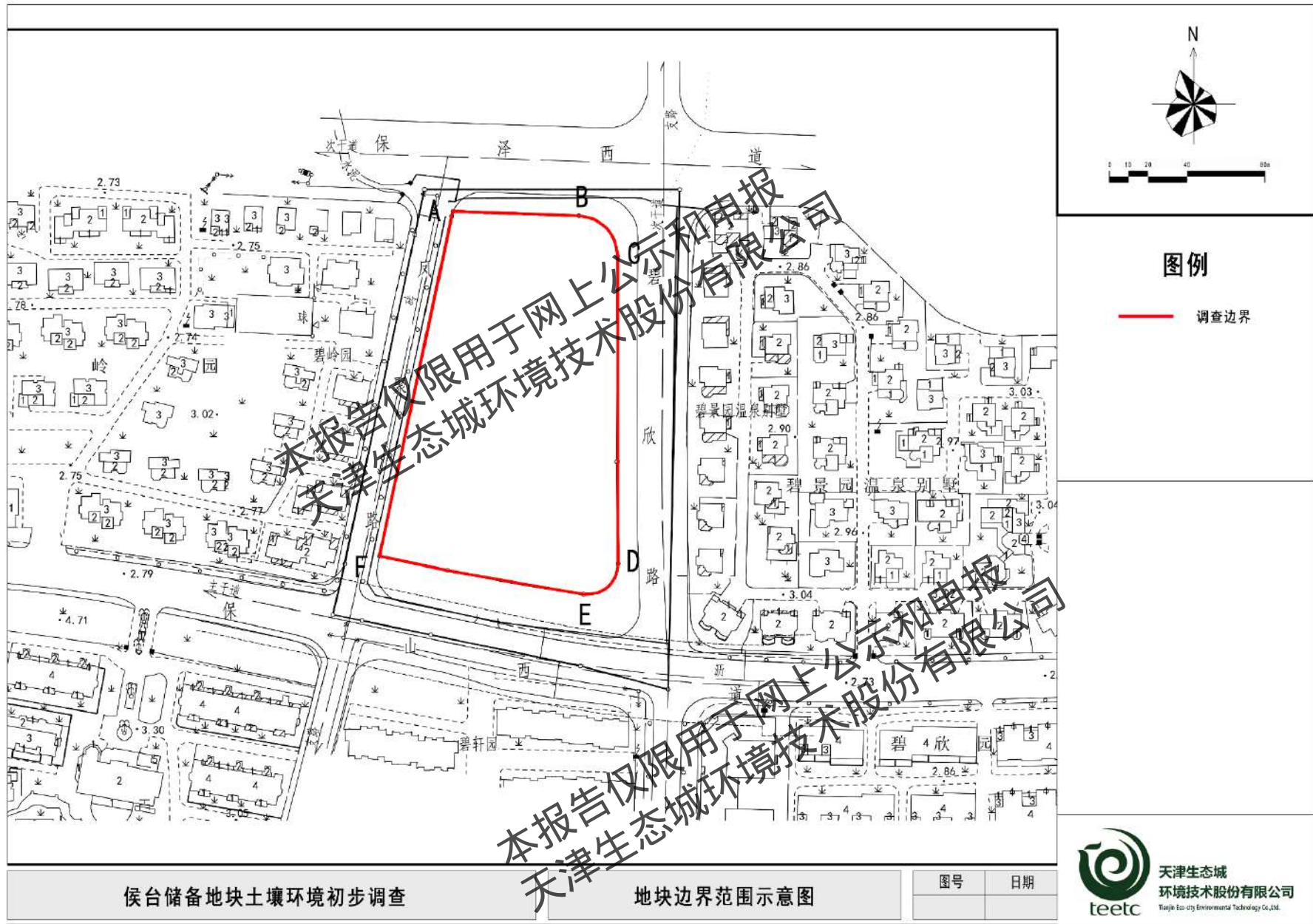
图 1.2-1 地块边界范围示意图